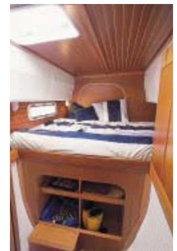
La version propriétaire offre une vaste couchette et une salle de bain privative. The owner version with a spacious cabin with private bathroom